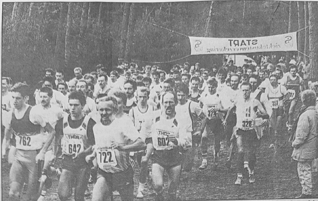
◆ Onmiddellijk na de start zijn de favorieten en 'recreanten' nog samen. Een ronde verder zal het veld sterk verbrokkeld onder het finishdoek doorkomen.