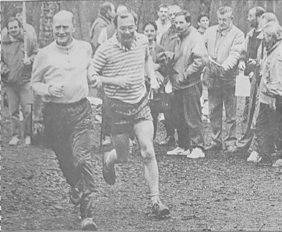
De veteranen in actie.