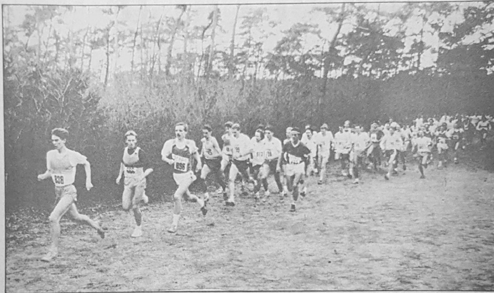
• De start van de wedstrijd bij de heren in de Spado-cross.