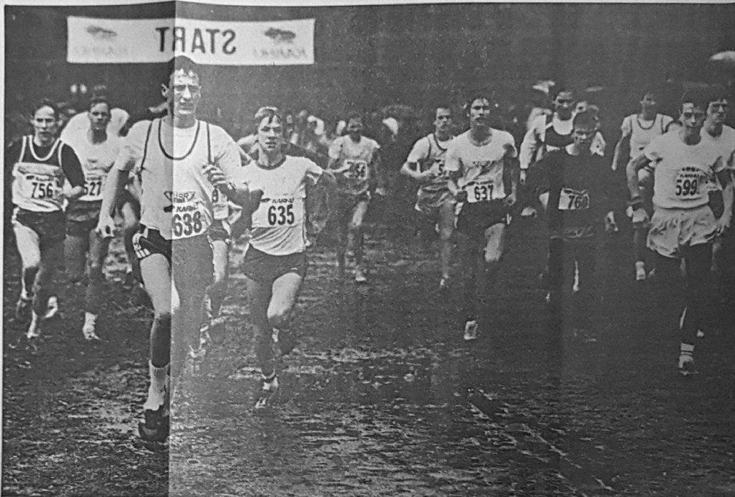
• De B-jongens in actie op het modderige parkoers in Bergen op Zoom.