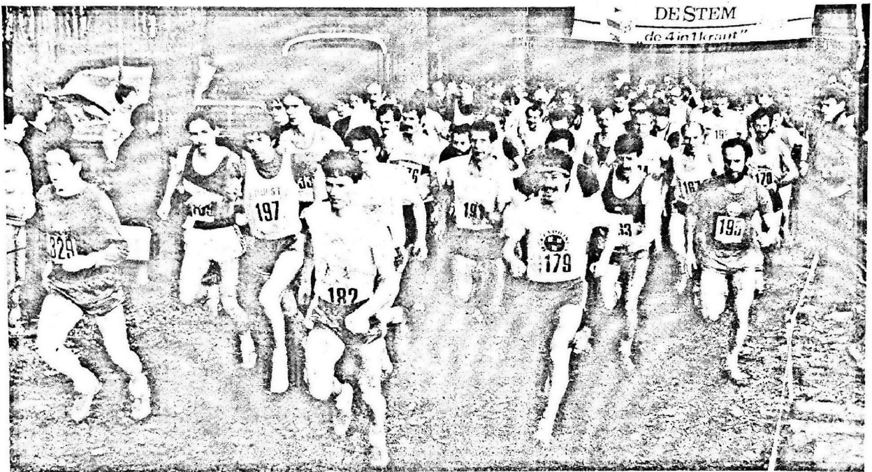
• De heren en veteranen beginnen aan hun cross in Zundert.

Hoewel het Zeeuwse duo Dalebout-Kooman alles in het werk stelde de ontstane kloof zo klein mogelijk te houden. Dat ging ten koste van Schoonen en Haast die het tempo niet konden volgen. Na de derde doorkomst bleek echter dat Koniuszek nog verder van zijn belagers was weggelopen. Gas terugnemen moest vervolgens ook Frank Kooman, die zich in de voorlaatste ronde gepasseerd zag door een sterk op-