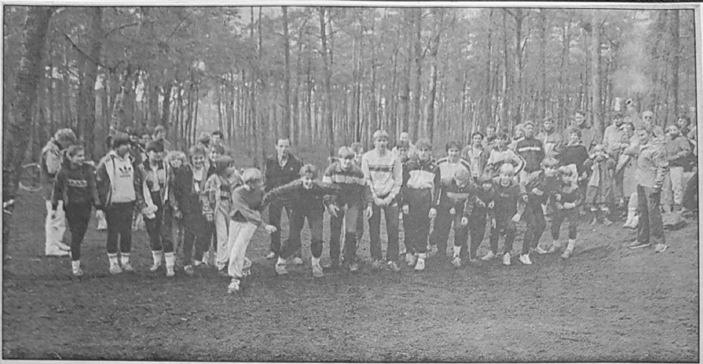
• De start van de junioren.