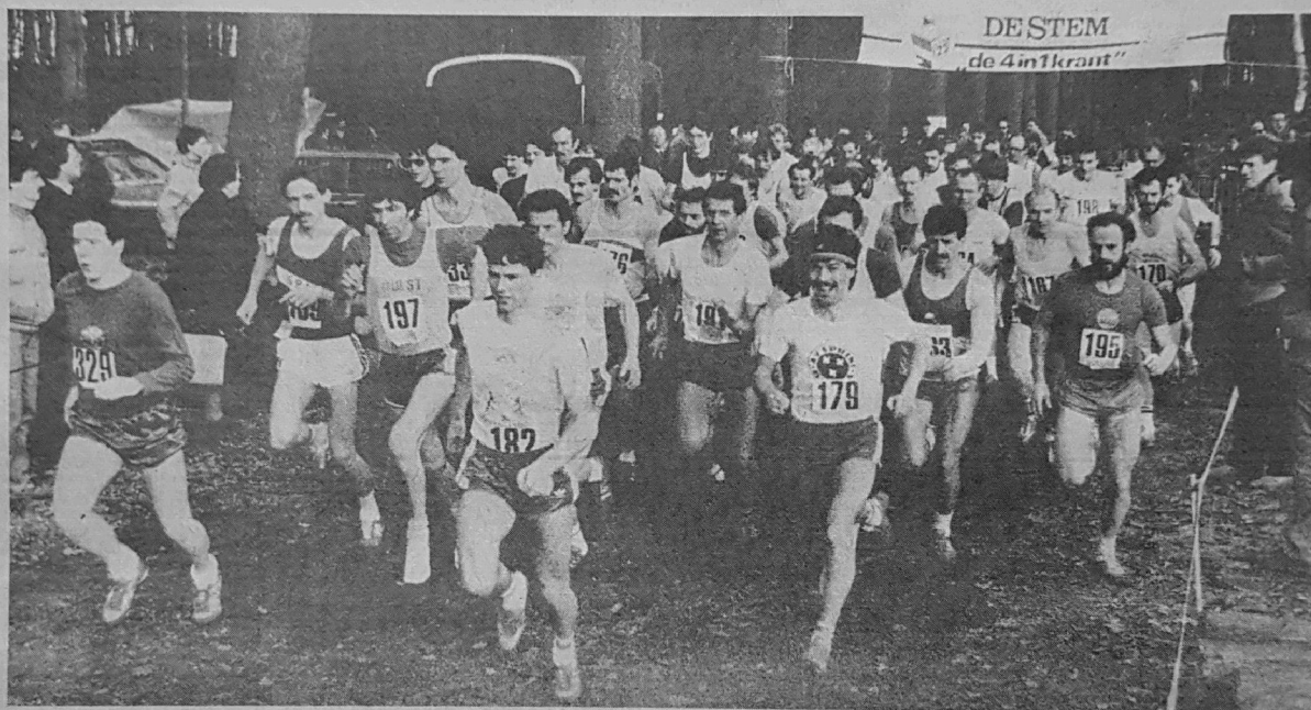
• De heren en veteranen beginnen aan hun cross in Zundert.

Hoewel het Zeeuwse duo Dalebout-Kooman alles in het werk stelde de ontstane kloof zo klein mogelijk te houden. Dat ging ten koste van Schoonen en Haast die het tempo niet konden volgen. Na de derde doorkomst bleek echter dat Koniuszek nog verder van zijn belagers was weggelopen. Gas terugnemen moest vervolgens ook Frank Kooman, die zich in de voorlaatste ronde gepasseerd zag door een sterk op-