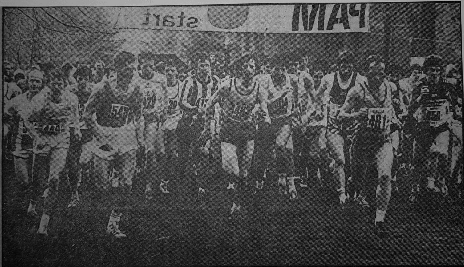
• Overzicht van de start van de elfde Liesboscross.