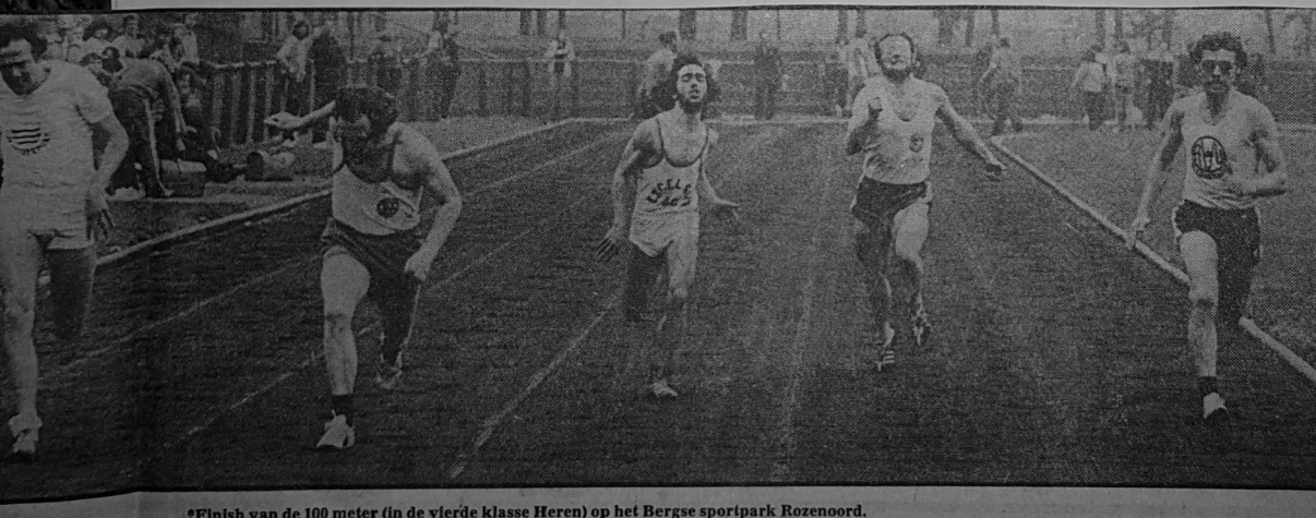
*Finish van de 100 meter (in de vierde klasse Heren) op het Berge sportpark Rozenoord.

HEREN, 3e klas: 1. Spado 10.599 pt., 2. Marathon 10.240 pt., 3. AVV 9995 pt., 4. Zld. Sport 9927 pt., 5. KMA (Breda) 9709 pt., 6. Spark (Spijkenisse) 9641 pt. 4e klas: 1. Excelsior (Oosterhout) 6698 pt., 2. Delta Sport (Zierikzee) 6607 pt., 3. DJA 6572 pt., 4. Schelde Sport 6165 pt., 5. Excelsior II 5575 pt., 6. Diomedon 5469 pt., 8. Scorpio 5029 pt., 11. DJA II 4178 pt.