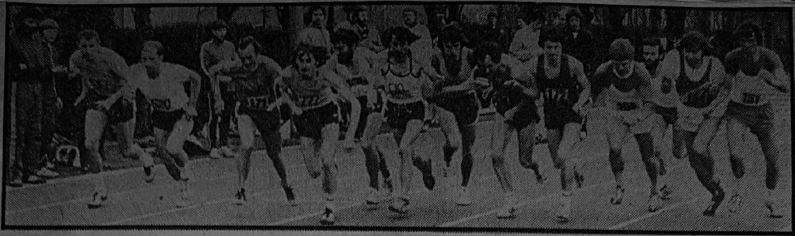
• Start van een 3000 meter-serie.